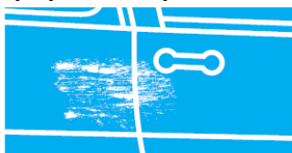
Odreté pravé dvere (obr. č. 8)