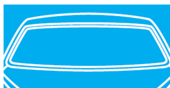
Čelné sklo (obr. č. 6)