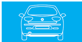
Pohľad zozadu (obr. č. 3)