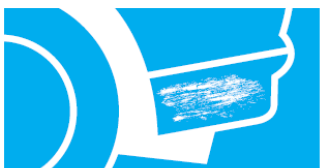
Poškrabaný ľavý zadný blatník (obr. č. 7)