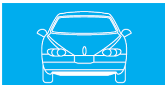
Pohľad spredu (obr. č. 1)